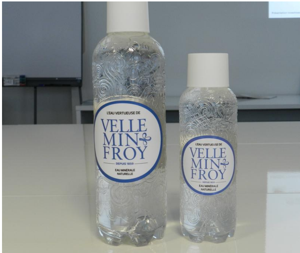
La bouteille se présente sous un emballage plutôt luxueux.

Près de cinquante ans sont passés. Et maintenant l'enthousiasme de Paul Poulaillon fait renaître la source. Paul Poulaillon a fait le choix d'investir 6,5 mil-